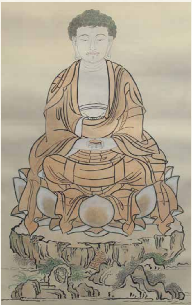
天瑞和尚が日々祈っていた 釈迦如来像の掛軸