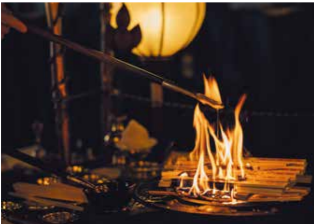
合同祈禱護摩木 一本 千円

五月十一日は「密厳堂」で行う最初の護摩祈禱です。稀なこの機会にぜひ参加ください。